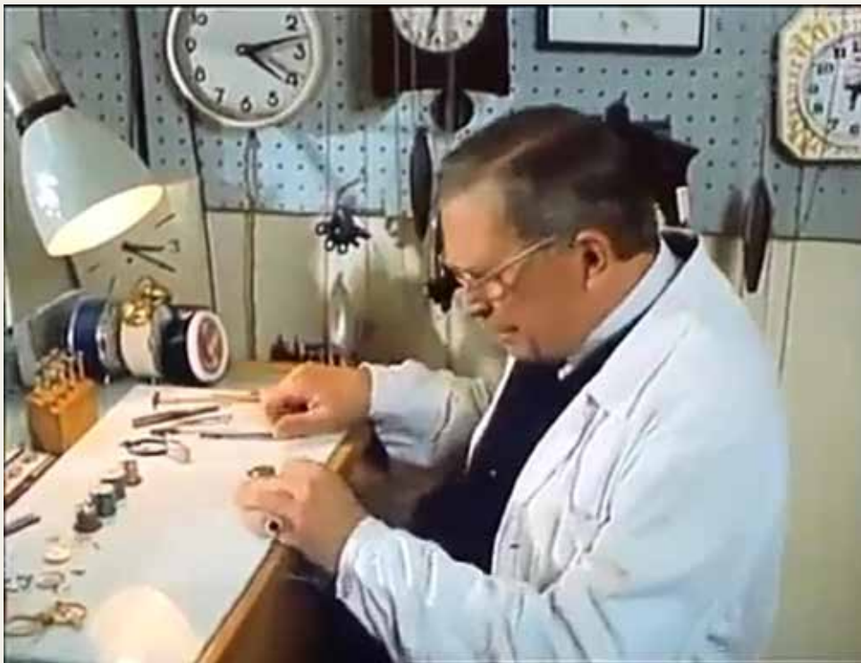
Film Neříkej mi majore! (1981), scéna z trhovosvinenských Klenotů. Herec Vladimír Ptáček jako hodinář Mojdľ.