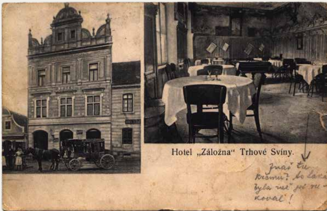
Pohlednice hotelu Záložna.