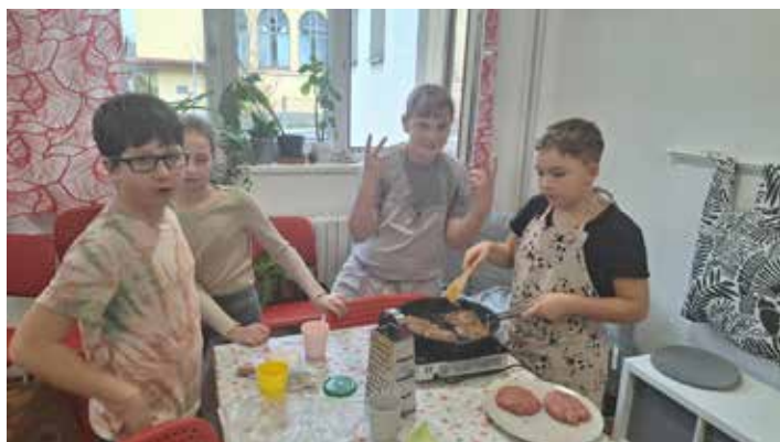
Vaření na příměstském táboře o jarních prázdninách