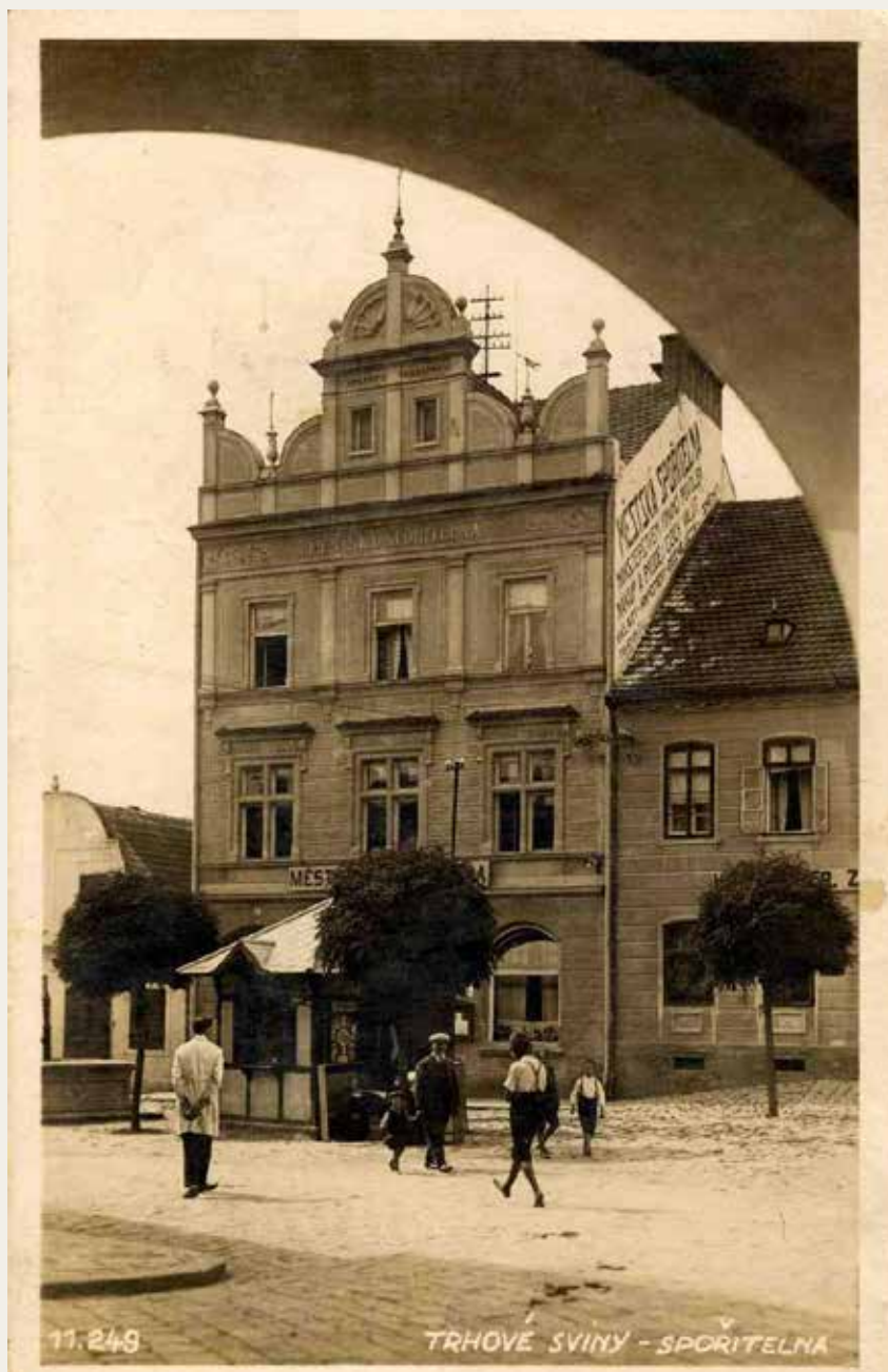
Prvorepubliková fotografie budovy.

Kdo nesl stavbu hotelu Záložna velmi nelibě, byla zdejší tělocvičná jednota Sokol. Kronikář spolku zmínil v zápisu z roku 1905, že realizací této stavby se znemožní vstup z náměstí do Sokolské ulice. To znamenalo, že