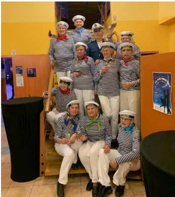
Uskupení "Srdce v rytmu"... a jejich plesová předtančení