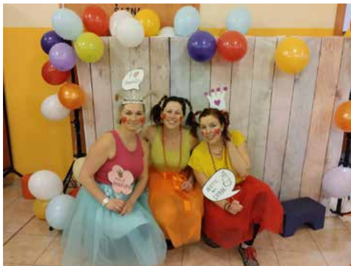
Karneval. Tým RC Trhováček.