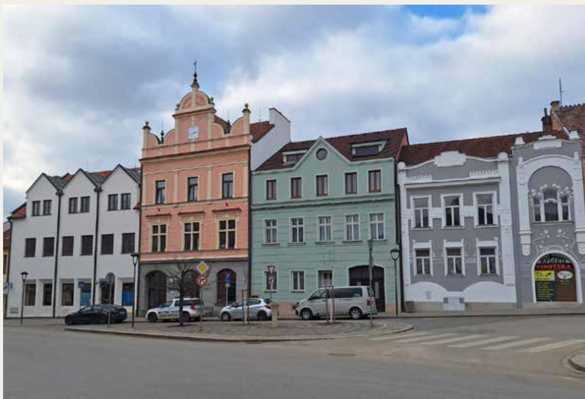
Tyto domy byly v minulosti sídlem hostinců. Hotel Záložna 2. zleva.